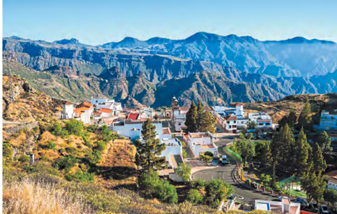
Im Gegensatz zu den meisten anderen Zielen sind die Mietwagenpreise auf den Kanarischen Inseln nur leicht gestiegen

Mallorca schrumpfte das Mietwagenangebot während der Pandemie um die Hälfte, in Portugal sogar um bis zu 70 Prozent. Nun ist die Nachfrage stark gestiegen und lässt sich nicht so einfach bedienen, das führt automatisch zu höheren Preisen. Zunächst sorgte der Chipmangel für Lieferprobleme, wegen des Ukraine-Krieges fehlt es jetzt zusätzlich an Bauteilen.