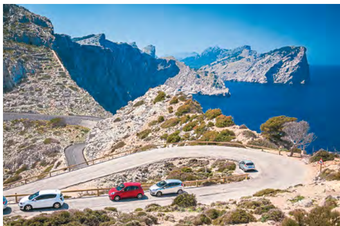
Auf Mallorca ist die Nachfrage nach Mietwagen besonders groß. Die Preise haben sich in der Hochsaison zum Teil versechsfacht

Metasearcher: Preisvergleichsportale wie Check 24 , Billiger Mietwagen , HappyCar oder der Holiday-Check-Ableger Mietwagen-Check , die den Kunden die zeitaufwendige Sucharbeit abnehmen. Auf ihren Seiten sind die internationalen Mietwagenkonzerne ebenso zu finden wie das Angebot diverser Broker sowie kleinerer Flottenbetreiber wie Centauro , Sicily by Car und Goldcar . »Wir schicken die Mietwagenanfrage über Schnittstellen in die große Runde und finden in Echtzeit den günstigsten Anbieter«, so Schifferholz.